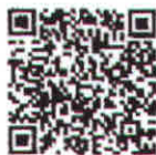
หลักเกณฑ์การเปิดโรงเรียนฯ

หัวหน้าผู้รับผิดชอบในการแก้ไขสถานการณ์ฉุกเฉิน ในส่วนที่เกี่ยวกับการสั่งการและประสานกับผู้ว่าราชการจังหวัด และผู้ว่าราชการกรุงเทพมหานคร